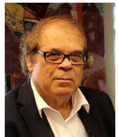
Pauli Kemi Redaktör