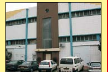
Tents of Mercys möteslokal.

Skicka din gåva till Tents of Mercy via Agape Församling Pg 440 42 05-9