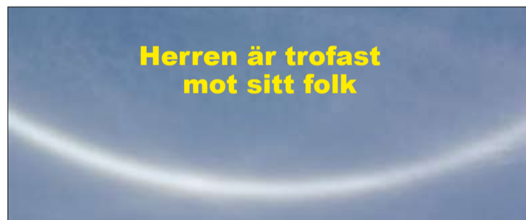
Den vita cirkeln över Yad Vashem Holocaust museet vittnade för oss om Guds trofasthet emot sitt folk. Hela cirkeln rymdes inte på bilden.

Text och foto: Pauli Kemi Översättning: Markus Kemi