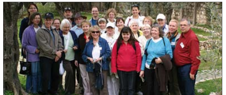
Vår grupp i Getsemane där vi hade en härlig förbönstund.