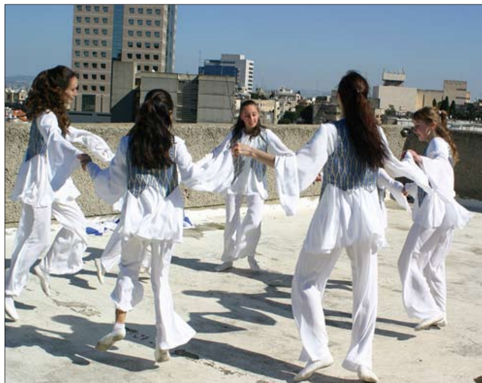
I Shavei Tzion församling i Haifa finns en stark lovsång med dans.