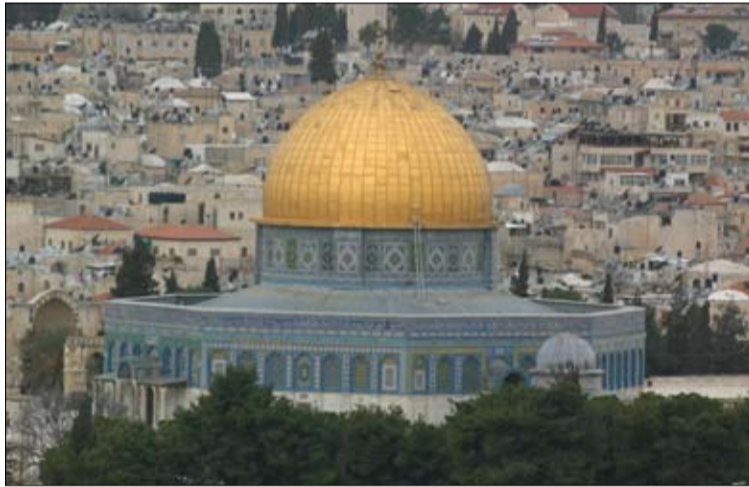
Jerusalem tillhör Israel och judar och dit skall Jesus komma tillbaka.

Jesus kommer tillbaka och han skall då komma just till Jerusalem och därför hårdnar kampen om Jerusalem innan hans ankomst. Muslimerna vill ha kontrollen över Jerusalem, och därför har inte Israel det lätt. I Libanon har Hizbollah nu mer vapen än vid förra sommarens krig. Syrien har placerat stora mängder missiler vid Israels gräns. Det har