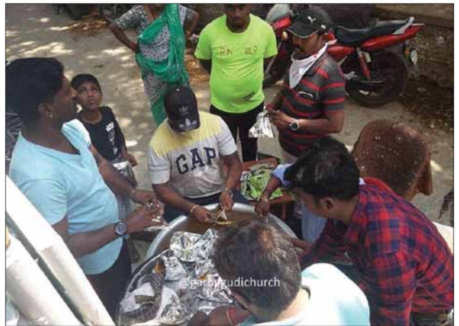
Ihmisille jaettiin myös ruokaa. Jeesus sanoi: ”Minun oli nälkä, ja te...”