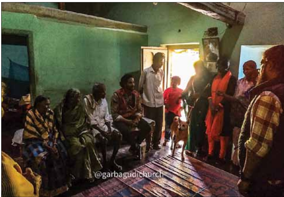
Kotikokouksessa julistetaan täyttää evankeliumia, Jeesus pelastaa ja parantaa.