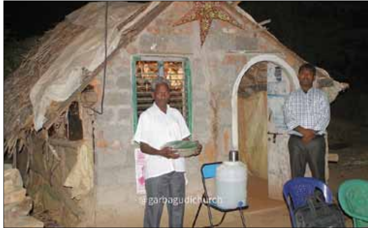
Kuvassa yksi Grace Gospel Missionin kyläkirkoista.